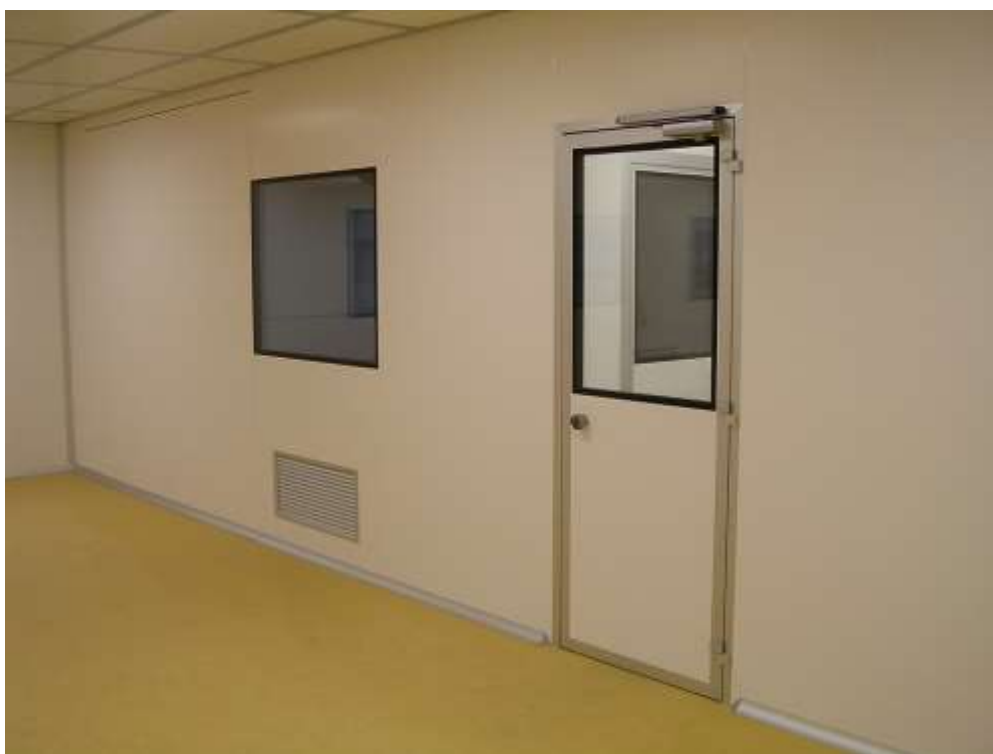
ОДНОСТВОРЧАТАЯ ДВЕРЬ С ПЕТЛЯМИ Dr. HANN

решения для помещений с повышенными требованиями по рентгенстойкости и огнестойкости. Доступны несколько вариантов отделки.